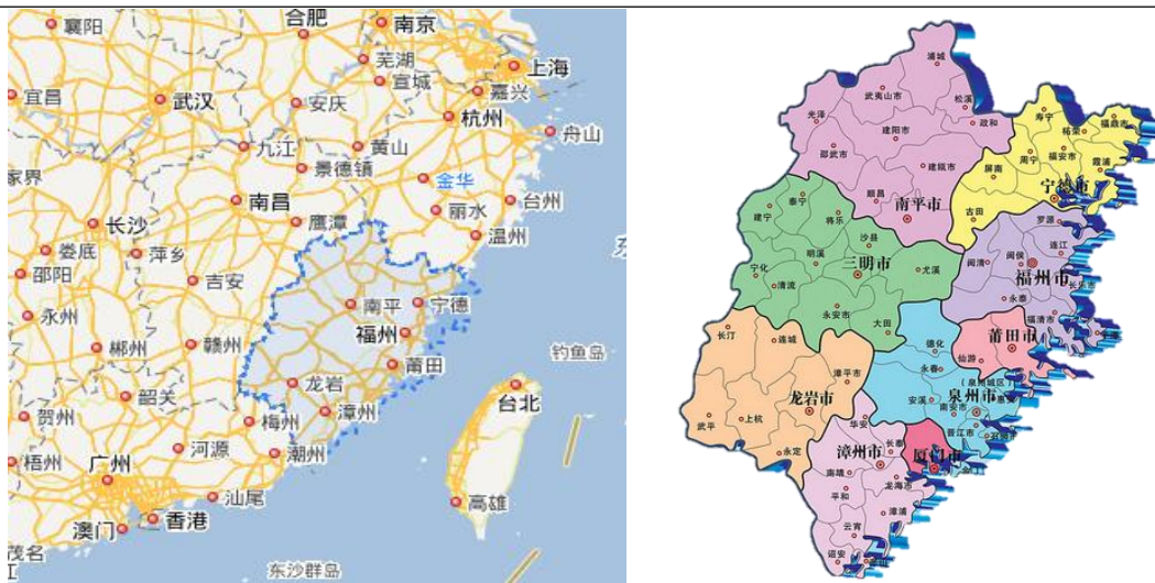
图表 2 福建省区位图

在对外交流方面，中欧班列及“丝路海运”航线加强了福建省与“一带一路”沿线国家及地区的往来，使得福建省成为陆上丝绸之路与海上丝绸之路的重要对接区域。厦门、平市、龙岩市、泉州市、宁德市和福州市等地市开通了中欧班列，形成覆盖俄罗斯、波兰、乌兹别克斯坦等“一带一路”共建国家的运输网络，通过海铁联运等创新模式，将“海丝”与“陆丝”无缝衔接，为福建及周边地区企业提供了高效的国际物流通道。从福建出发的“丝路海运”航运国际物流平台在基础设施硬联通、规则标准软联通等方面取得了一系列成果。2025 年，福建省新增 15 条“丝路海运”命名航线、14 家联盟成员，新开辟 5 条通往中西部多式联运线路。在文化交流方面，福建省发挥着连接两岸、联通世界的独特桥梁作用，特别是在对台交流、海丝文化传播、文化遗产保护等领域成果显著。2025 年，福建持续推进闽台人文交流，海峡两岸文博会、IM 两岸青年影展成功举办、世界闽南文化交流中心加快建设。